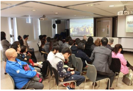
透過短片回顧過去一年的活動