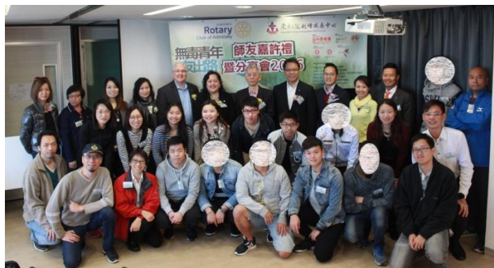
嘉賓、師友大合照，嘉許禮完滿結束