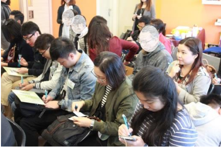
師友認真參與願望花瓶活動