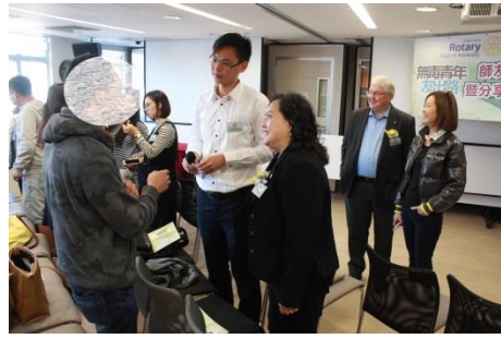
主禮嘉賓與計劃青年談天