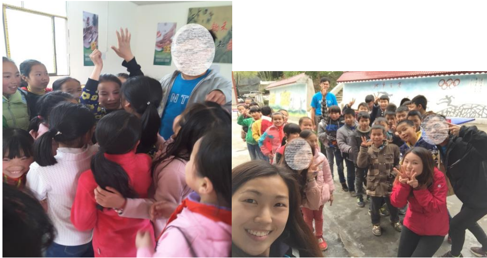
學生投入活動，互相鼓勵。

經過第二天下午在小學的活動，團友和小學生已經建立了一定的默契。因此，團友們於第三天早上安排一些合作性要求較高的團體活動予小學生，他們表現認真投入，各青年人及師友渡過了愉快的一天。當日傍晚，團友到達另一間中學進行音樂交流。中學生及老師教授桐歌，團友則與他們分享了一首廣東歌－「海闊天空」。當日晚上，團友在酒店的房間進行分享，彼此互相檢視過程得失，互相欣賞，帶著難忘的回憶及心情為旅程作總結，透過這次交流團的經歷，提醒自己珍惜生命，回饋社會。