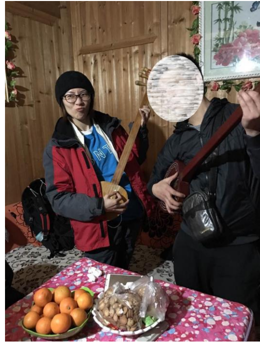
第一天下午到達晚寨遊覽，並進行家訪及認識當地民族文化遺產－桐歌。