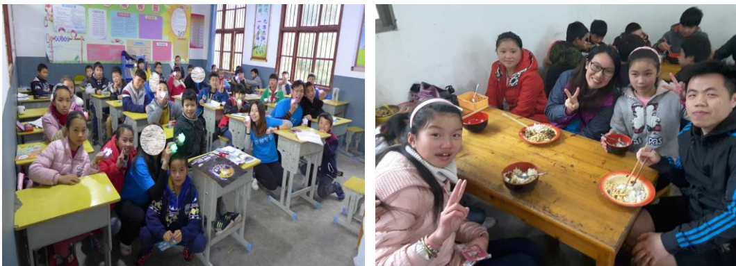
師友及青年人爭取時間了解當地學生的生活及文化。