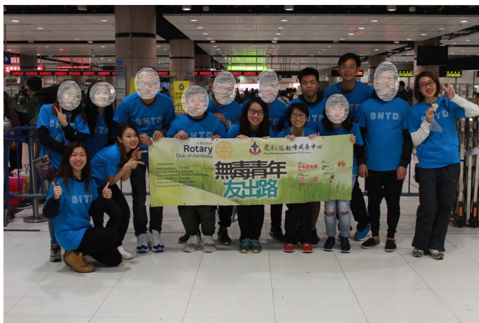
出發前大合照，各團友精神奕奕。