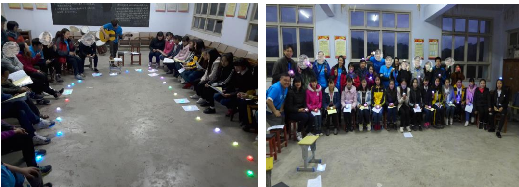
於中學舉辦音樂交流晚會，點點燭光互相分享。