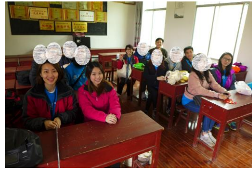
與當地小學生融洽傾談及預備遊戲。