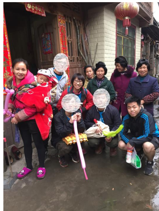
到小村落進行家訪，與村民暢談生活點滴。