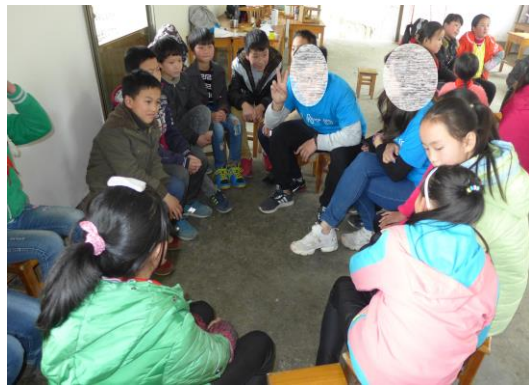
各團友及學生積極參與，氣氛熱烈。