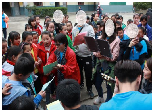
在學校操場舉辦小型音樂會，分享兩地音樂文化。