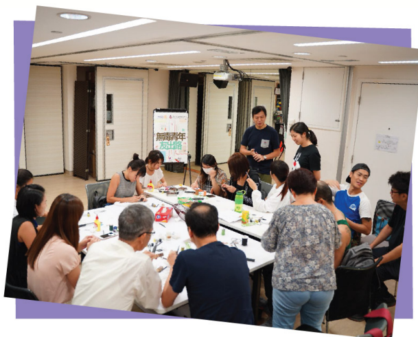
師友皮革共聚小組(10/8/2018)