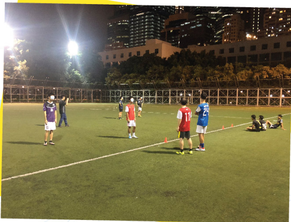
足球小組師友培訓系列(6,13,20/7/2018)

除了基本的毒品知識、溝通輔導技巧及程序設計外，計劃亦引入不同培訓的元素擴闊師友們的知識及技巧，例如動機式面談法及FIDA家庭介入卡。