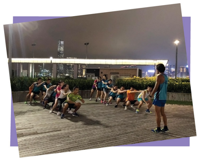
跑步組團隊歷奇活動(25/8/2018)

透過團隊歷奇活動也能加深與青年人彼此的互信及支持的關係，他們均投入參與活動，亦加深他們的互信及支持，師友及青年人均投入活動當中。另外，透過活動招募師友及青年人參加，促進互相溝通及彼此間的了解。