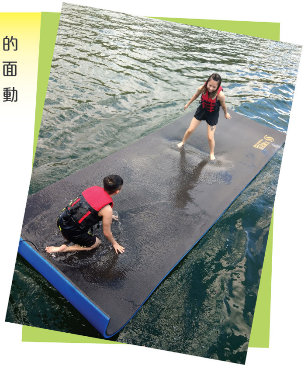
長洲船P團隊歷奇活動(23/9/2018)