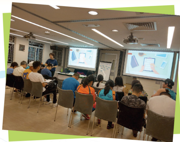
應用「動機式訪談法」於師友指導培訓工作坊(第三課)(17/12/2018)