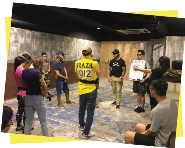
紅磡射擊團隊活動(23/9/2018.30/12/2018)