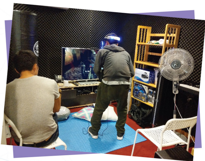
VR 體驗活動 (20/10/2018)