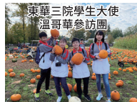
東華三院學生大使 溫哥華參訪團