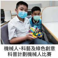
機械人、科藝及綠色創意 科普計劃機械人比賽