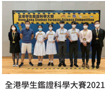
全港學生鑑證科學大賽2021