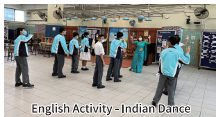
English Activity - Indian Dance