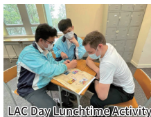
LAC Day Lunchtime Activity