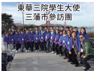
東華三院學生大使 三藩市參訪團