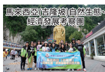
馬來西亞(吉隆坡)自然生態、 經濟發展考察團