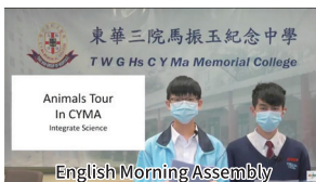
English Morning Assembly