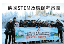
德國STEM及環保考察團