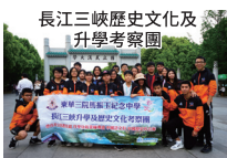
長江三峽歷史文化及 升學考察團