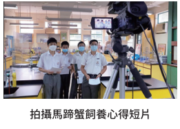
拍攝馬蹄蟹飼養心得短片