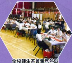
全校師生茶會氣氛熱烈