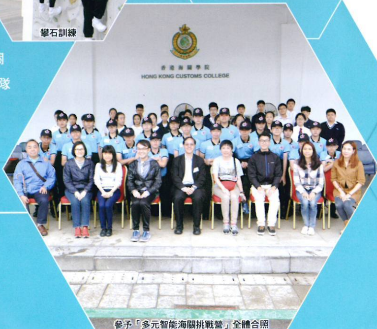
參予「多元智能海關挑戰營」全體合照