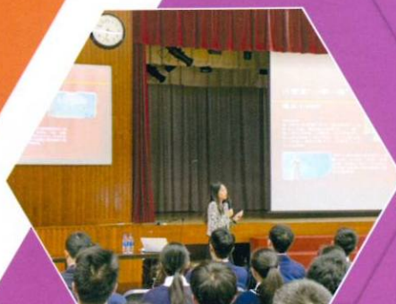
週會課：一帶一路與中國外交