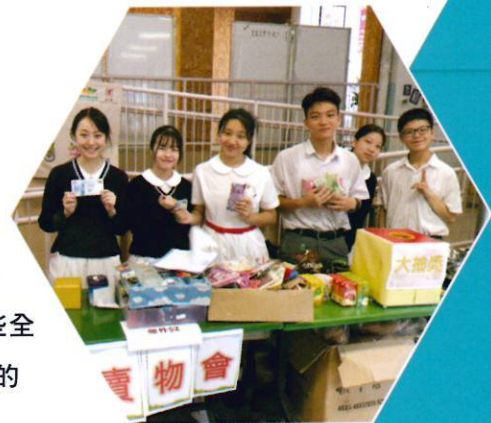
鳳翎賣物會全體工作人員合照

透過收集全校師生的捐贈物品，經本科的師生作整理及定價後，向全校進行義賣活動。本年度除了有捐贈的物品作義賣外，還購買一些全新的精品，包括水樽、電風扇等適合同學使用的物品。另外，大抽獎、關東煮攤檔、射擊攤位都大受師生歡迎。最終籌集到超過$1000的善款，並全數捐入本校學生會作學生活動發展之用。