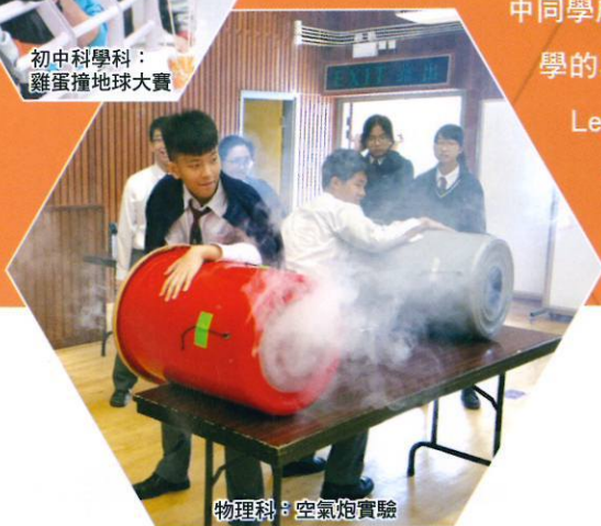
物理科：空氣炮實驗