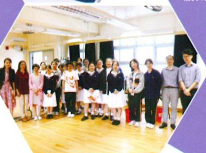
課外活動組老師與茶味小集及學生完成茶會後合照