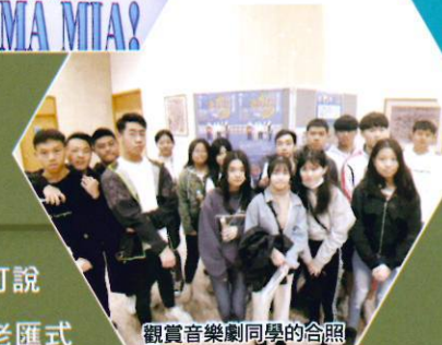
觀賞音樂劇同學的合照