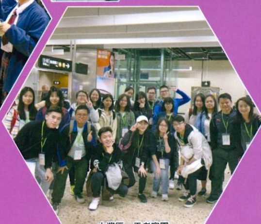
大灣區一天考察團