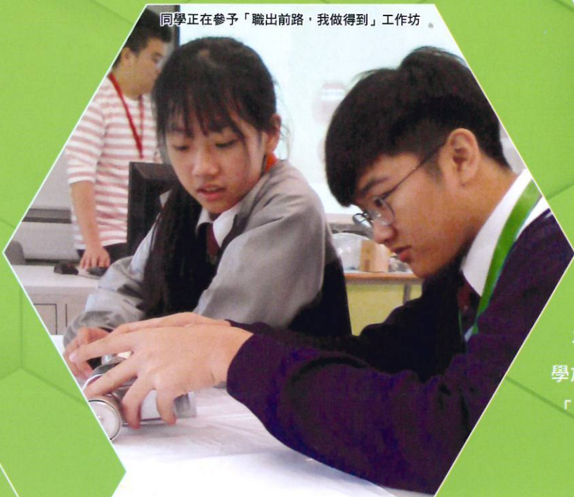
同學正在參予「職出前路，我做到」工作坊。