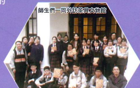
師生們一同外訪茶具文物館