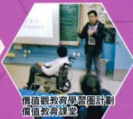
價值觀教育學習圈計劃 價值教育課堂