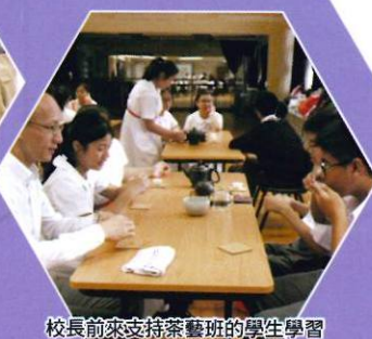
校長前來支持茶藝班的學生學習