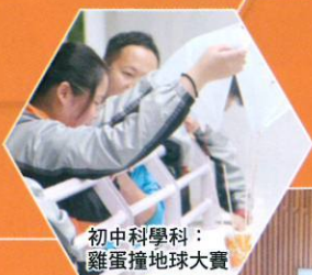
初中科學科： 雞蛋撞地球大賽