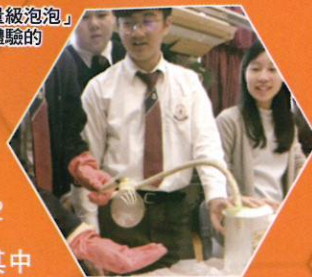
化學科：「重量級泡泡」 二氧化碳吹泡體驗的 攤位活動

本學年之STEM WEEK活動已於3月27日至4月2日順利舉行。是次STEM WEEK 內容豐富多元，其中包括生物科組主辦的中三級「我要健康」微電影創作比賽，由同學分組拍攝出一段段精彩活潑的創意影片，介紹不同與飲食相關的疾病，向全校師生傳遞關注飲食健康的信息。而物理科組及化學科組則圍繞大氣作主題，分別以空氣炮實驗及「重量級泡泡」二氧化碳吹泡體驗的攤位活動，讓全校同學從玩樂的趣味中感受空氣流動的能量，同時學習有關氣體密度的知識。而中一、二級同學亦進行雞蛋撞地球大賽，同學把預先製作好的降落傘投放，相互比拼落地時間、落點的準確度和落地時的撞擊力，而投選出最接近火箭返回艙設計的降落傘。過程中同學成功把科學知識應用於日常生活，更藉親身探究發掘對科學的興趣。此外，本校今年更有幸邀請有自學爸爸之稱的Leo分享其自學自造機械臂的經歷。Leo以生動有趣的方式示範機械臂的原理，令在座的同學興致勃勃地對仔細觀看，開敞同學認知科學的大門。