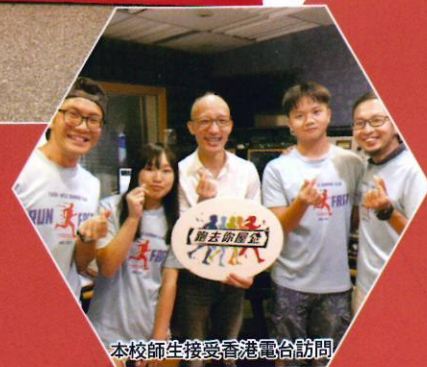
本校師生接受香港電台訪問